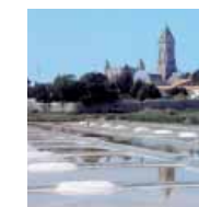
Communes, cantons et arrondissements