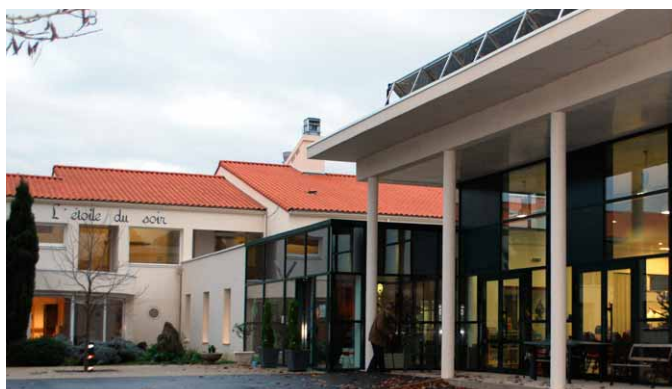
Architecte Pelleau & Associés